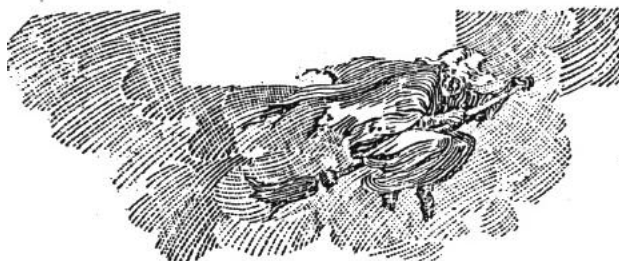
Table des matières du " Diablo en Belgique " Roberto J. PAYRO (ou Payró) : IEA3637 PARTIE 1 (pages 1-37 : "LE DIABLE ARCHITECTE", "UNE CREATURE D'APOCALYPSE" (LE "VERT-BOUC"), "LE PACTE AVEC LE DIABLE", "LE STRATAGEME DE SAINT-REMACLE", "LE TILLEUL DES PENDUS" et "LE SORCIER DU CONDROZ".) : http://idesetautres.be/upload/IEA3637A%20DIABLE%20EN%20BELGIQUE%20PAYRO%201%20001-037.zip IEA3637 PARTIE 2 (pages 37-73 : "LA DAME BLANCHE DE NADRIN", "LES PROTEES BELGES" (DONT LES DIABLES D'EAU), "LE DIABLE EN BELGIQUE" et "LE FIANCE DE LA MACRALLE" :

Attaché à la Bibliothèque Royale Albert Ier.